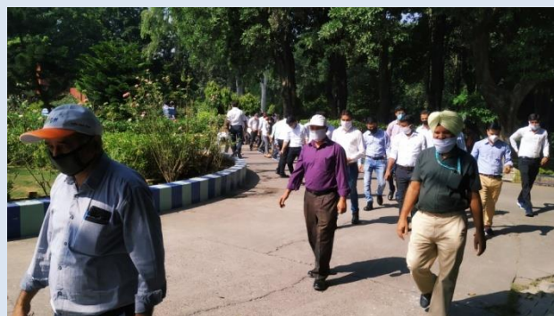
PRINCIPAL/TTC LEADING SWACHHTA PAKHWARA 2021