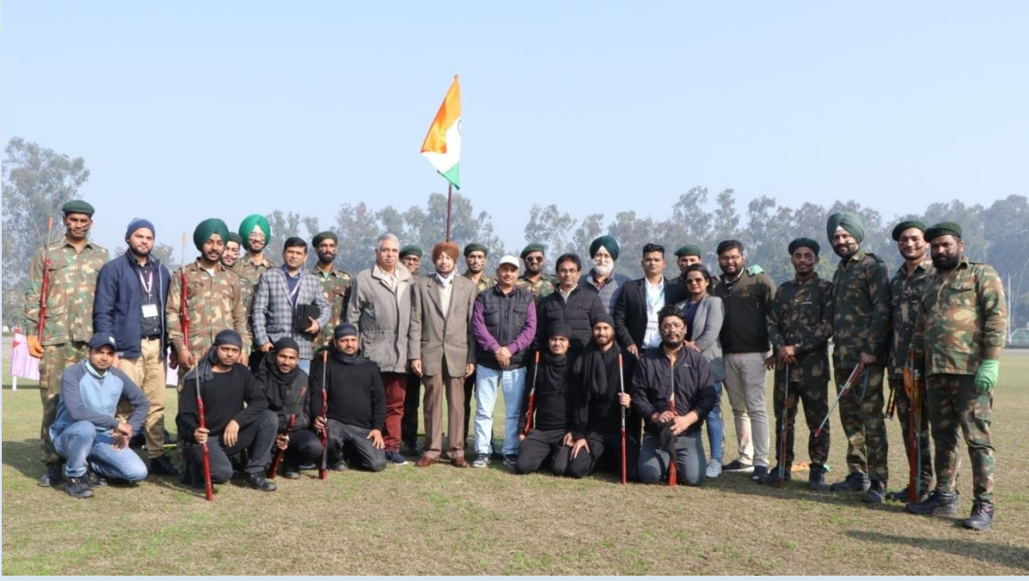
REPUBLIC DAY CELEBRATION 2021 (TTC TEAM) गणतंत्र दिवस समारोह २०२१ (टीटीसी टीम)