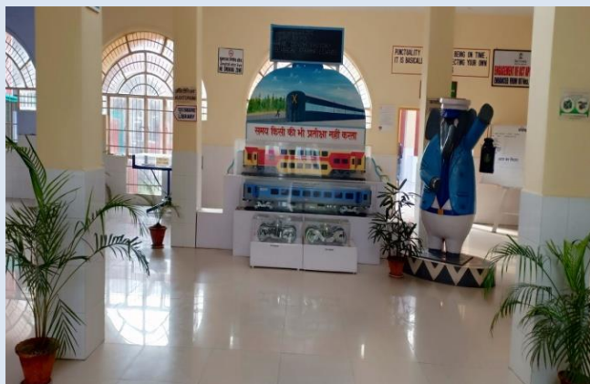
TTC ENTRANCE टीटीसी प्रवेश