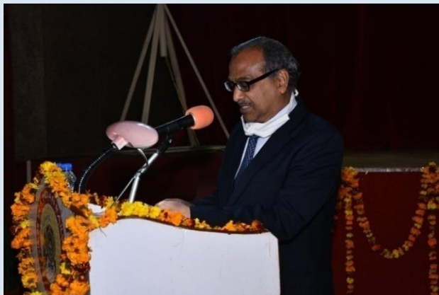
Inaugural Speech by PCME