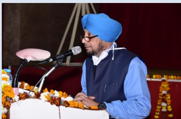
Anchoring by DY.CME/Co-ord.