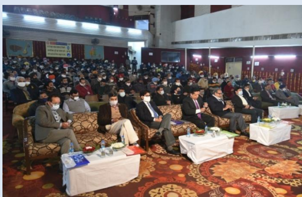
PDP 2021, at Warish Shah Hall