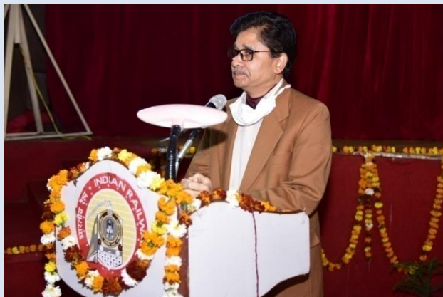
Inaugural Speech by GM