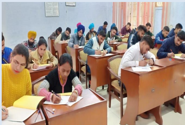
CLASSES IN TTC टीटीसी में कक्षाएं