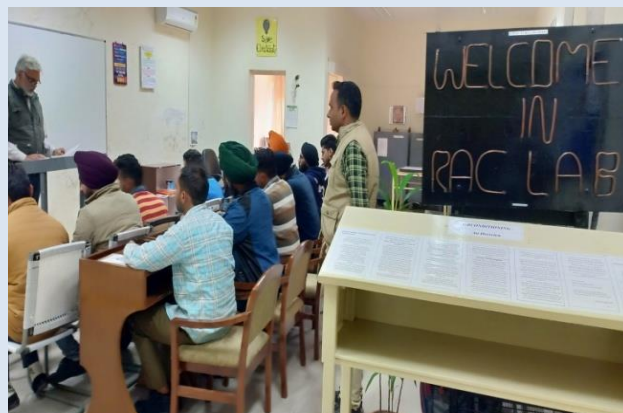
CLASSES IN TTC टीटीसी में कक्षाएं