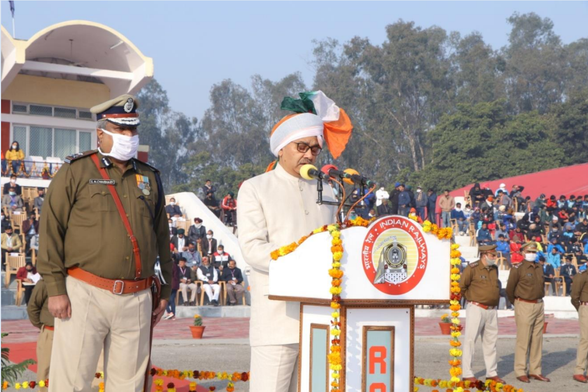
REPUBLIC DAY CELEBRATION 2021 गणतंत्र दिवस समारोह २०२१